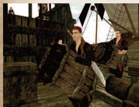
Режиссёру — две бочки вдохновения!

Впрочем, вернёмся к нашей беседе. Ждать ли нам новой серии вашей выдающейся фильмы?