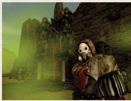
Скар Кроу на фоне декораций для 4 серии.

Сами эти рассказы о приключениях английского пилота и его лучшего друга во время Второй мировой войны. Разумеется, совершенно без каких-либо готических составляющих. И мне всегда хотелось снять по этим рассказам фильм. Увидев мув «Без Него» от «Вызова», понял, что такое можно реализовать, и подумал, почему бы и нет? Так и решил заняться машинимой. Но, сделав свой «Сон», забросил это дело.