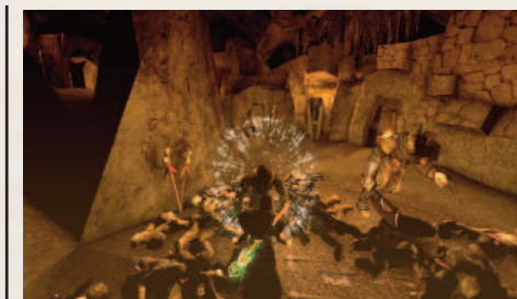
Какое-то из «Пробуждений».

Как выяснилось, пробуждать любят не только нижнегатийцы, но и суровые парни из Миртаны.