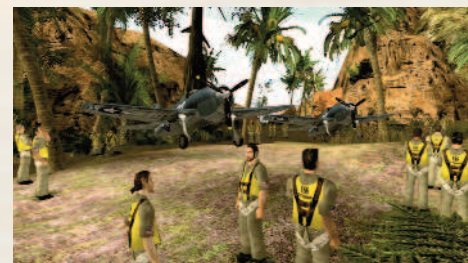
Яркендарская авиабаза и Регис в роли пилота.

Первую свою машиниму я сделал в 2011 году, но куда не выкладывал, делал исключительно для себя. Называлась она просто и незамысловато: «Сон». Именно этот фильм был своего рода подобием и предком «Лунатика», который сейчас можно спокойно посмотреть. В «Лунатике» действовали те персонажи, которые были придуманы очень и очень давно — герои так называемых «Рассказиков», которые когда-то писал.